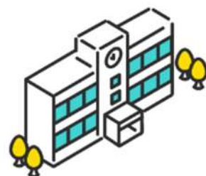
八洲学園大学国際高等学校